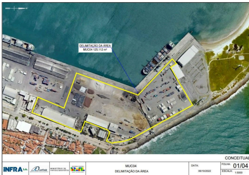
Figura 1 - Área de arrendamento MUC04 – Porto de Fortaleza.

3.4. A superfície total da área do arrendamento MUC04 é de 125.112 m 2 (cento e vinte e cinco mil cento e doze metros quadrados). A sua localização pode ser identificada na figura a seguir.